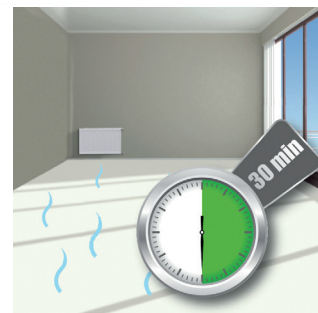
Bescherming van 'vochtige' linoleumvloeren